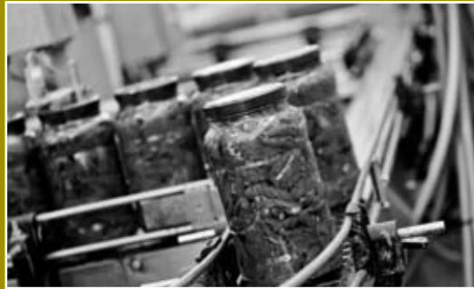
Carciofi - Olive - Funghi - Creme Patè Antipasti